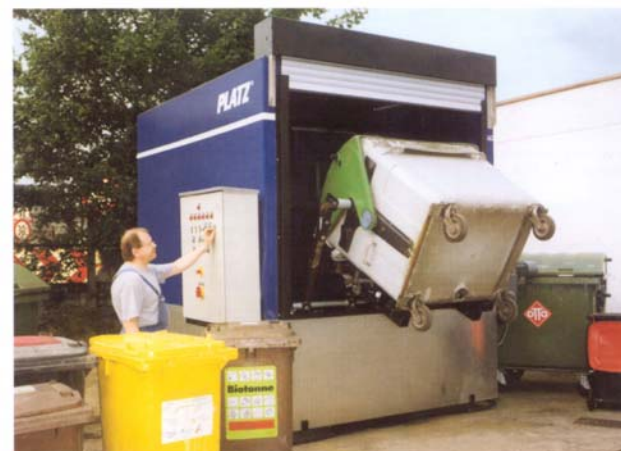
und Müllcontainer bis 1.100 Liter oder beides im Wechsel

Wirtschaftlich und ökologisch! Geringer Wasserverbrauch durch Schmutzwasser-Recycling, Entfettungsanlage auf Wunsch.