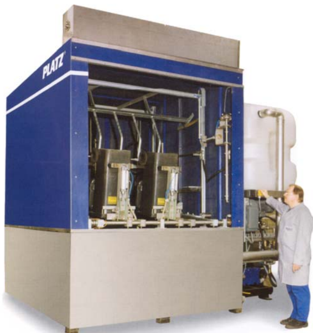
Wasch-Station MCR duo reinigt Mülltonnen von 80 bis 240 Liter...

Das Ergebnis kann sich sehen lassen: Pro Takt zwei Tonnen in 3 Minuten oder pro Stunde 40 Mülltonnen oder 20 Müllcontainer (je nach Verschmutzungsgrad).